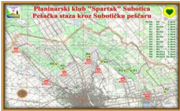
Карта суботичке пешчаре

10:00. Долазак на периферију Суботице и полазак на пешачку туру Суботичком пешчаром у околини Суботице. Стаза је благо заталасана, терен сличан Делиблатској пешчари а дужина пешачке туре је око 13 км