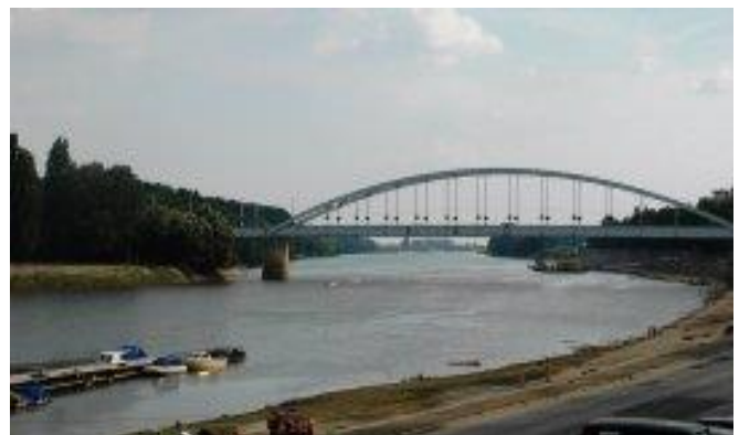
Стаза уз Тису