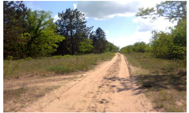
Једна од стаза суботичке пешчаре

14:30. Долазак у Келебију и прелазак Мађарске границе